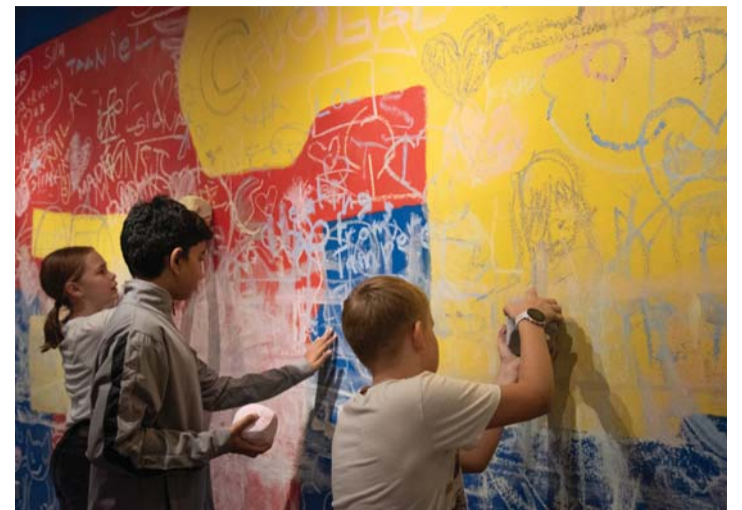
Näitus „Viltuse maja saladused“ Tartu kunstimuuseumis. Tunnustatud kunstnike ja laste koostöös loodud interaktiivsed teosed võimaldavad kohapeal ise kunsti luua, uusi reegleid leiutada ja läbi seinte rännata.

Selleks, et külastused oleksid õppetöoga tihedalt seotud ning et noor külastaja saaks talle kasuliku ja meeldejääva kogemuse, on kultuuriasutused koostanud väga põnevaid, mitmekülgseid ja kaasahaaravaid haridusprogramme. Koolide tagasiside kinnitab, et kultuuriasutuste pakumised on õpetajateni jõudnud,